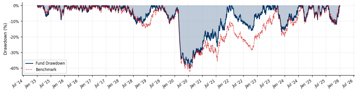
Abb. 2. Rollierender Drawdown: Fonds vs. Benchmark. Max. Drawdown Fonds: -39.88% vs. Benchmark -42.40%.

Bei einer annualisierten Volatilität von 13.54% gegenüber 14.40% für den Benchmark operiert der Fonds auf einem geringerem absoluten Risikoniveau und erzielt überlegenen risikoadjustierte Renditen (Sharpe 0.93 vs. 0.54). Der Tages-VaR (95%) von 1.34% und CVaR von 1.76% entsprechen einem aktienähnlichen Risikobudget.